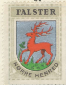
Falsters Nørre Herred

Maglebrænde, Torkilstrup, Lillebrænde, Gundslev, Nørre-Vedby, Nørre-Alslev, Vaalse, Kippinge, Brarup, Stadager, Nørre-Kirkeby, Ønslev, Eskilstrup, Tingsted.